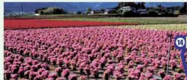
●三重さつきの花畑 鈴鹿市の花に指定 全国一出荷量を誇る地域の特産品 C=BUS ⑩長沢下車