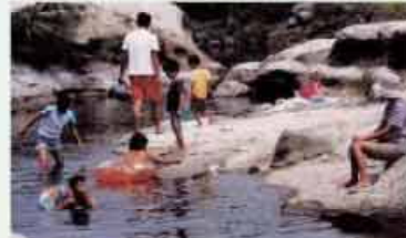
●御幣川 鮎を伊勢神宮に献上したことに由来 夏場の水遊びのスポット C=BUS ⑭鈴峰出張所下車