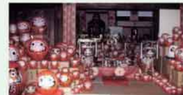
●江西寺 遠藤大師による諸願成就の祈願寺 だるま供養祭が有名 C=BUS ⑮深伊沢出張所下車