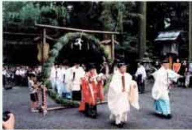
●樽大社 伊勢一宮猿田彦大本宮みちびきの祖神さま C=BUS ⑦樽大社下車