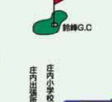
●ゆりの木 庄内小学校の校庭にある落葉樹で黄色の花が可憐 C=BUS ⑤庄内出張所下車