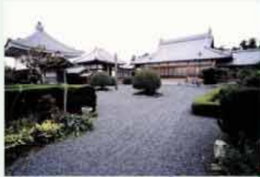
●鏡泉寺 坂上田村麿東征のあり念持仏観音像を安置し戦勝を祈願 C=BUS ⑭鈴峰出張所下車