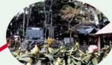
●神明社 深溝の氏神 水神社と大黒稲荷を祀る石楠花が美しい C=BUS ⑮深伊沢出張所下車