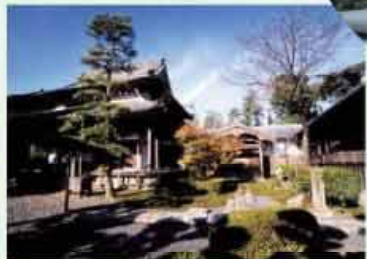
●深廣寺 真宗高田派長補山深廣寺 C=BUS ①ながさわ保育園下車