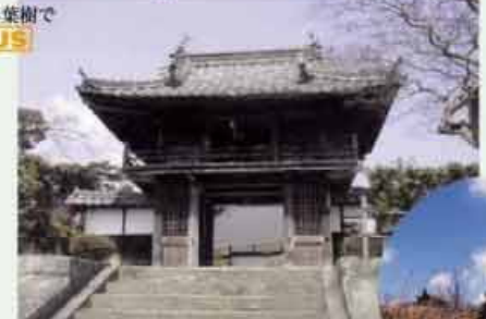
●金光寺 姫塚 昔を物語る大きな欄干が重厚 後花園天皇第一皇女が葬られた姫塚がある C=BUS ③階下車