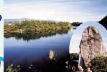
●龍ヶ池 悲しい人柱伝説のある池 C=BUS ⑮伊船口下車