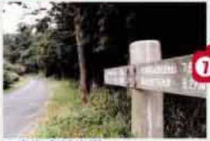
●東海自然歩道 自然、史跡、眺望に恵まれた鈴鹿山麓の自然道 C=BUS ⑩小岐須溪谷口下車