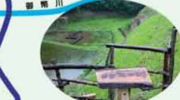
●めだかの郷 絶滅指定品種 交雑されていない純粋種のメダカが棲息 C=BUS ⑤庄内出張所下車