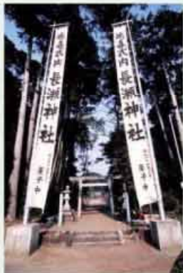
●長瀬神社 日本武尊御陵と片歌碑 C=BUS ⑥長沢下車