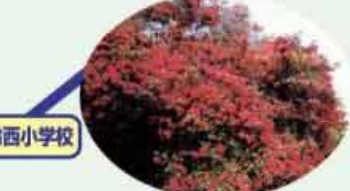
●キリシマツツジ 市指定の文化財 樹齢300年 高さ2.5mを誇る C=BUS ⑫京新田下車