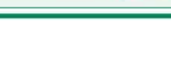
●野登山(国見石) 標高851mの山頂から伊勢湾を眺望できる C=BUS ⑦上野下車