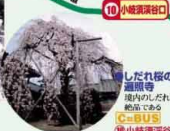
●小岐須溪谷と屏風岩 新緑と紅葉、清流と奇岩が美しく、キャンプで賑わう C=BUS ⑩小岐須溪谷口下車