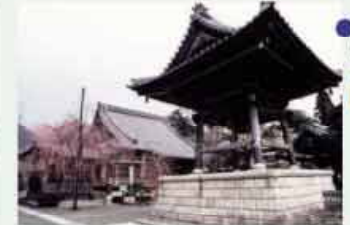
●法雲寺 県指定文化財薬師如来像と大久保城址 C=BUS ⑤大久保下車