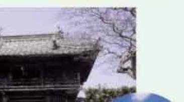
●養福寺の白寿観音菩薩 C=BUS ④北条下車