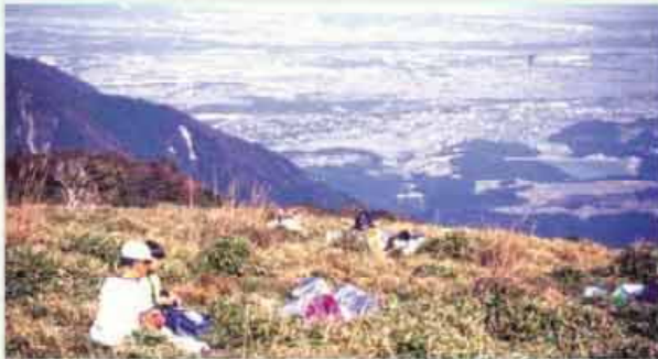
●入道岳 アセビ(県指定天然記念物)群生とハンクワイダー基地として有名 C=BUS ①樽大社下車