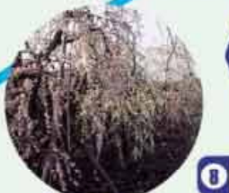
●清泉寺 境内のしだれ梅 2月下旬が見頃 C=BUS ⑧北畑下車