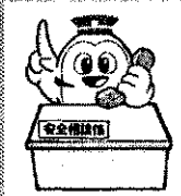
警察シンボルマスコット「ミーボくん」