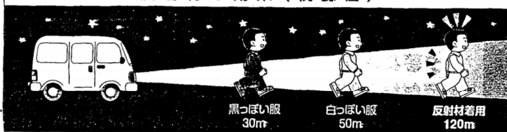
反射材の効果(視認性)